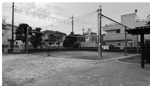
新曾新田口児童遊園地

音や安全性の懸念から多くの公園でボール遊びが禁止されていましたが、市はルールと設備の見直しにより、より柔軟な運用へと舵を切りました。新たに整備されたのは、喜沢2丁目児童遊園地、新田口児童遊園地の二箇所です。 ボール遊びができるエリア、ルールを明確にする事で、トラブルを未然に防ぎながら自由な遊びを支えています。