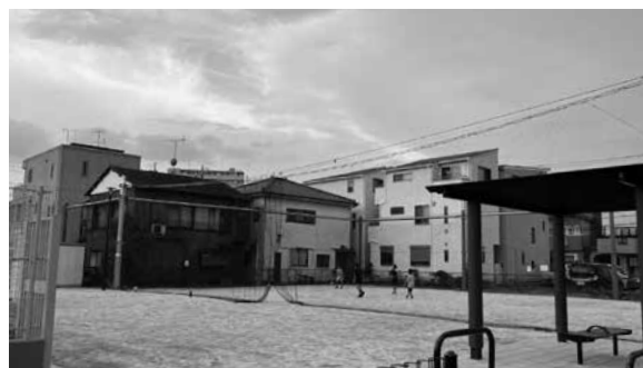
喜沢2丁目児童遊園地

音や安全性の懸念から多くの公園でボール遊びが禁止されていましたが、市はルールと設備の見直しにより、より柔軟な運用へと舵を切りました。新たに整備されたのは、喜沢2丁目児童遊園地、新田口児童遊園地の二箇所です。 ボール遊びができるエリア、ルールを明確にする事で、トラブルを未然に防ぎながら自由な遊びを支えています。