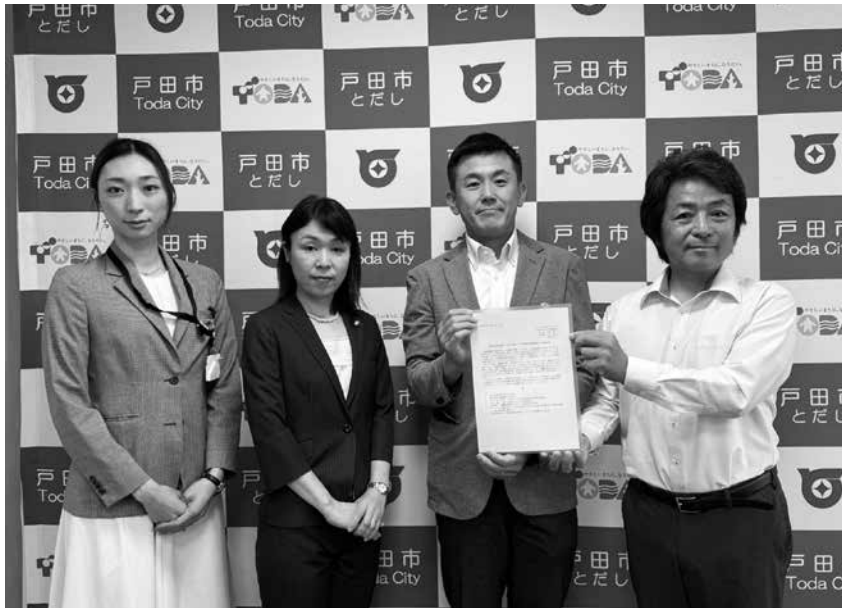
市長に要望書を手渡す党市議団 =6月27日

日本共産党戸田市議団は、6月27日、戸田市の県内1位の豊かな財政を活かし「深刻な物価高騰から市民の暮らしを守る緊急対策の実施を求める要望書」を菅原文仁市長に提出。要望項目の早期実施を求めました。